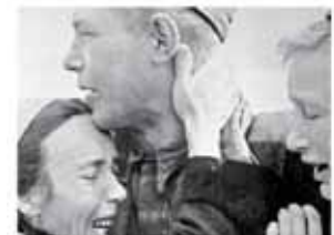
Vasili Grossman Vida y destino

Barcelona: Galaxia Gutenberg / Círculo de Lectores, 2007