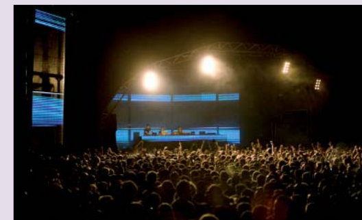
Sónar 2008: apoteosis de la música electrónica y el arte multimedia