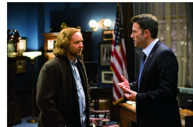
Fotograma de La sombra del poder (2009) en què Russell Crowe encapçala un repartiment estel·lar que dona vida a un thriller sobre un congressista i un reporter que es veuen implicats en un cas de brutals assassinats.

Quan, l'11 de setembre de 2001, els atemptats contra Nova York i Washington fan caure els pilars de tota una manera d'entendre el món, el cinema és, lògicament, un dels principals afectats. Els atacs provoquen la suspensió de no poques estrenes (la majoria sobre segrestos aeris o atemptats en territori nord-americà) i provoquen una involució tant des del punt de vista visual com conceptual: només així s'entén l'insistent ocultisme de les Torres Bessones (arribant a retirar un tràiler de Spider-man perquè hi apareixien) o el retorn a la pitjor manifestació de les gestes bèl·liques dels 80, com a Tras la línea enemiga , dedicades ara a exaltar el paper de les forces d'intervenció nord-americanes a l'estranger. Però, a diferència dels temps de Reagan, la complicitat de la indústria amb les decisions de Bush dura ben poc, i de mica en mica els contraris al règim aconseguen imposar (i exportar) el seu missatge. Només així s'explica que pel·lícules tan agosarades com United 93 , Redacted o En el valle de Elah tinguin una distribució normalitzada i, especialment en el primer cas, un cert impacte en taquilla. Fins i tot Spielberg ha donat el millor de si mateix amb dos títols de perfil tan diversificat com La guerra dels móns (un film més subversiu del que se li va voler reconèixer en el seu moment) i l'extraordinària Munic , que significativament acaba amb un pla de les Torres Bessones com a metàfora del que passa quan es perpetuen els conflictes polítics.