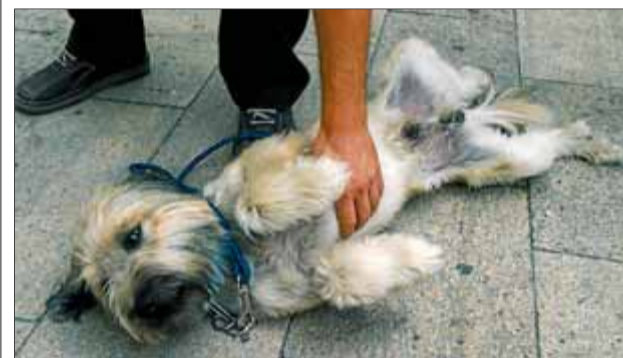
Les noves àrees per a gossos de Barcelona permetran la relació i interacció entre animals i propietaris