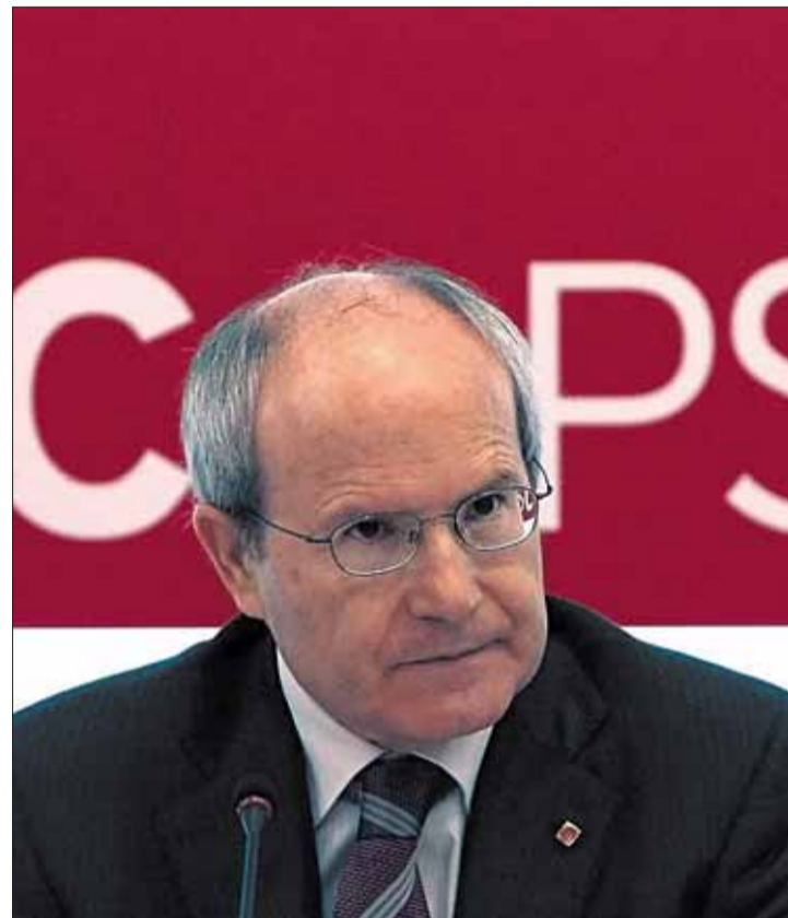
El primer secretario del PSC, José Montilla, ayer.

Los socialistas catalanes están inmersos en un periodo precongresual, que será el 18 de julio, que empezará mañana con la presentación de la