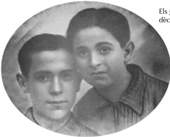
Els germans Pallach a la dècada dels anys 30.