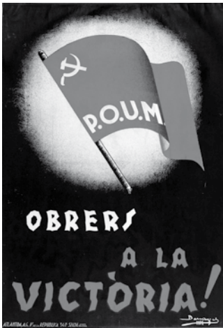
Póster del P.O.U.M, any 1935. Edició nº 22, Col·lecció de 20 targetes postals de cartells antifeixistes. Comissariat de Propaganda de la Generalitat de Catalunya.