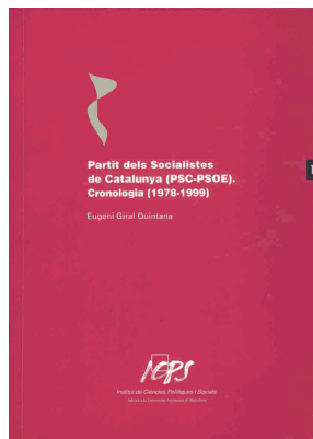
Portada del llibre d'Eugeni Giral

El contingut d'aquest llibre es pot consultar a internet a l'adreça http://www.icps.es