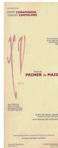
Tarja de l'última edició dels Premis Primer de Maig

Com cada any hem celebrat junt amb la Fundació Josep Comaposada el lliurament dels Premis Primer de Maig. Aquest any el premi a la Memòria Popular ha estat concedit al programa especial "Franquisme: oblidar o recordar" de Televisió de Catalunya. Aquest programa es va emetre el passat mes de març dividit en tres capítols: Veus ofegades , Cartes d'un exili a França (dedicat a les cartes escrites a França pels refugiats republicans catalans entre 1939 i 1945), Els Maquis, la guerra silenciada (sobre el testimoni dels guerrillers catalans que van lluitar contra el franquisme durant més de vint-i-cinc anys) i Els nens perduts del franquisme (centrat en la separació de nens fills de republicans de les seves famílies). Aquest treball fruit d'una recerca periodística rigorosa va tenir un important impacte social i un ampli ressò mediàtic en exposar un tema que s'ha mantingut silenciats durant molts anys: els efectes de la guerra civil durant els primers anys de postguerra.