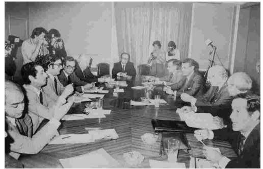
Reunió entre el President, els caps dels partits amb representació parlamentària i el representant del Govern espanyol.