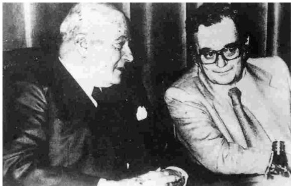
Josep Tarradellas amb Joan Reventós.

L'onze de setembre fou una altra data fonamental en el procés amb la celebració a Barcelona d'una manifestació multitudinària en que participaren més d'un milió de catalans, que van expressar la voluntat de tenir la seva pròpia autonomia política. Finalment i després d'un treball laboriós s'arribà a l'acord entre el President Tarradellas, els parlamentaris catalans i el Govern espanyol respecte al reconeixement de la Generalitat de Catalunya; que es concretà en la publicació el dia 29 de setembre del real decret llei de restabliment de la Generalitat. El moment culminant de tot el procés fou el retorn històric del President Tarradellas a Catalunya el dia 23 d'octubre.