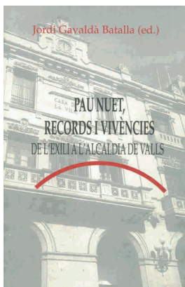
Portada del llibre dedicat a Pau Nuet

La Fundació Josep Recasens de Reus junt amb l'Agrupació de Valls del Partit dels Socialistes de Catalunya, han editat aquest llibre dedicat a l'estudi de la trajectòria vital del que va ser alcalde de Valls entre 1979 i 1991. Nuet explica les vivències del seu exili i el seu pas per la màxima institució municipal. Des de la seva estada al camp de refugiats de Sant Cebrià a França fugint de les tropes franquistes fins arribar a la seva tasca al capdavant del consistori vallenc, un cop