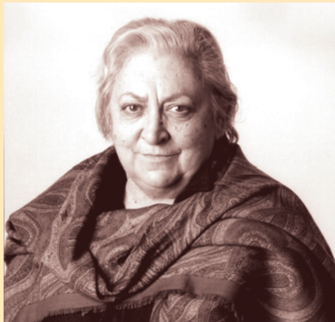
Maria Aurèlia Capmany

A part la seva prolífica obra escrita, que abasta des de la novel·la fins al teatre, passant per l'assaig, l'articulisme, el guionisme, la cançó..., és també impressionant l'enormitat de facetes que Maria Aurèlia Capmany va desenvolupar durant la seva vida, en un autèntic esclat de passió i d'intel·ligència, en una aposta optimista i esperançada